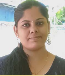
അശ്വതി. വി. വി.