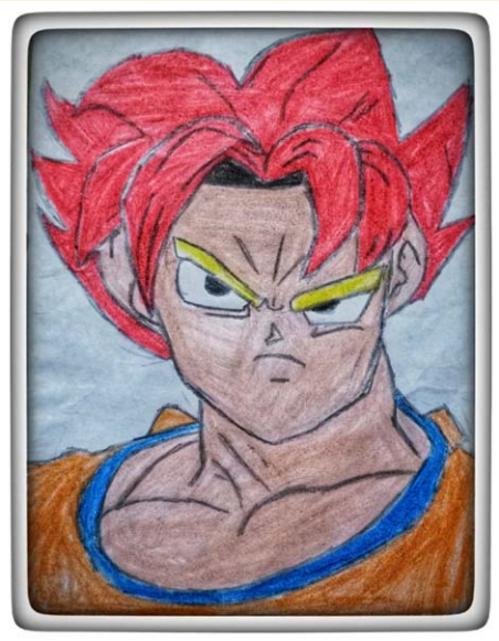
അദ്വൈത് വി ആർ വടക്കേപുരക്കൽ ഹൗസ് കാരയാട്ടുകര എൽത്തൂരുത്ത് സെന്റ് അലോഷ്യസ്സ് എൽ പി സ്കൂൾ Std 3